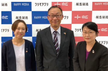
▲VC/広域FM事業部 VC課スタッフ

岐阜本社にあるVC課。VCとは「Voluntary Chain(ボランティア・チェーン)」の略。VC加盟契約により、ハッピーメディア。「地域みっちゃん生活情報誌。」を全国で発行し、地域社会への貢献とともにフリーメディアを形成する情報インフラを築くプロジェクトです。VC加盟社が安心して情報誌を発行できるよう、当社のフリーマガジン発行のノウハウを共有し研修、営業アドバイス、創刊後のフォローアップなどを行っております。