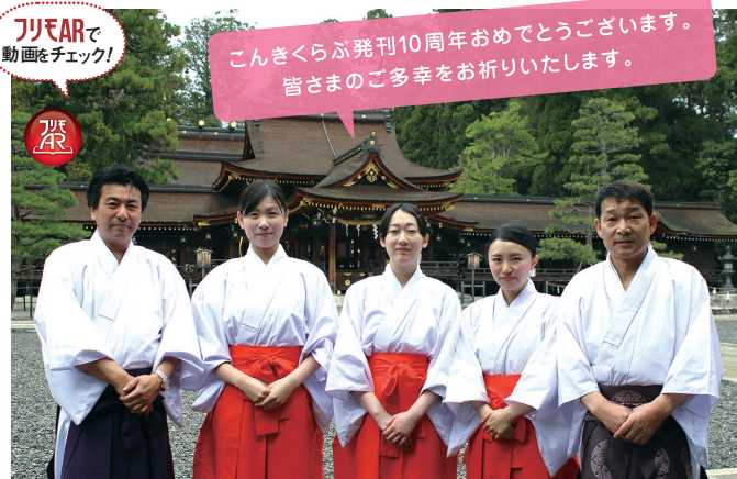
2014年4月号・2009年1月号で紹介した多賀大社の皆さん

3年未満 28% 5年未満 26% 創刊号から 19% 8年未満 14% 1年未満 8% 3カ月未満 5%