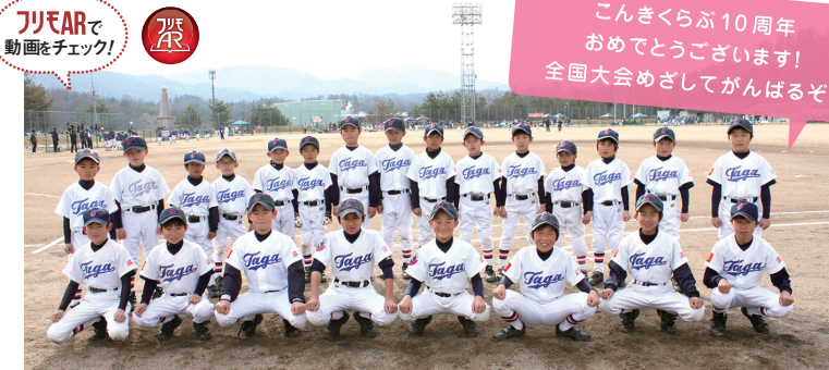
2007年6月号で特集した多賀少年野球クラブの子どもたち

グルメガイド 50% 最初から読む 11.8% 巻頭特集 11.8% Kiss Kiss Kids 9% ヘアサロンガイド 4.9% 占い 2.8% イベントニュース 2.1% ヘルスガイド 1.4% ハウジング情報 1.4% プレゼントページ 1.4%