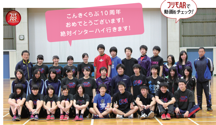
2008年7月号で紹介した滋賀県立彦根翔陽高等学校ハンドボール部の皆さん