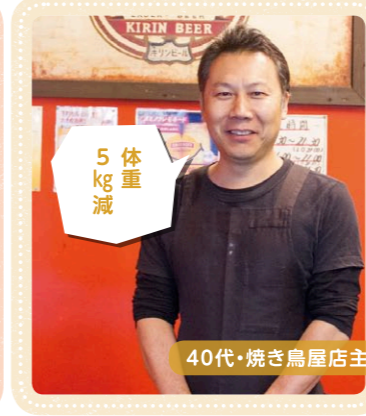
40代・焼き鳥屋店主