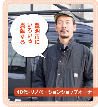
40代・リノベーションショップオーナー