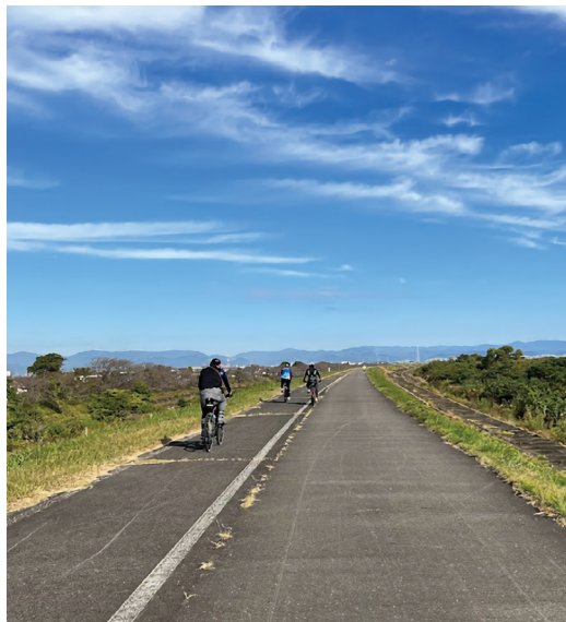
羽島市近郊には自転車道が充実。初心者から上級者向けまで、さまざまなコースを設定しています

者を誘致。ツアーやイベントなどを行い、自転車の聖地を目指して地域を活性化していくというのが「BLOCK47」の狙いです。 初心者から上級者まで気軽に自転車を楽しむ 「BLOCK47 Cycle」は、「自転車を楽しみたい」という初心者こそおすすすめ。地元の人、観光客も気軽に利用できるように、レンタサイクルを用意。ロードバイク、クロスバイクなどを用意しており、気になった自転車を気軽に体験できます。 自転車借りたら「BLOCK47」を拠点にサイクリング。桜や紫陽花なども楽しめる羽島グリーンウェイはもちろん、大規模自転車道の長良川自転車道や長良川清流自転車道もあります。現在、おすすすめのコースは10コース以上。将来的にはコースの案内をしてくれるアプリケーションの導入も予定し