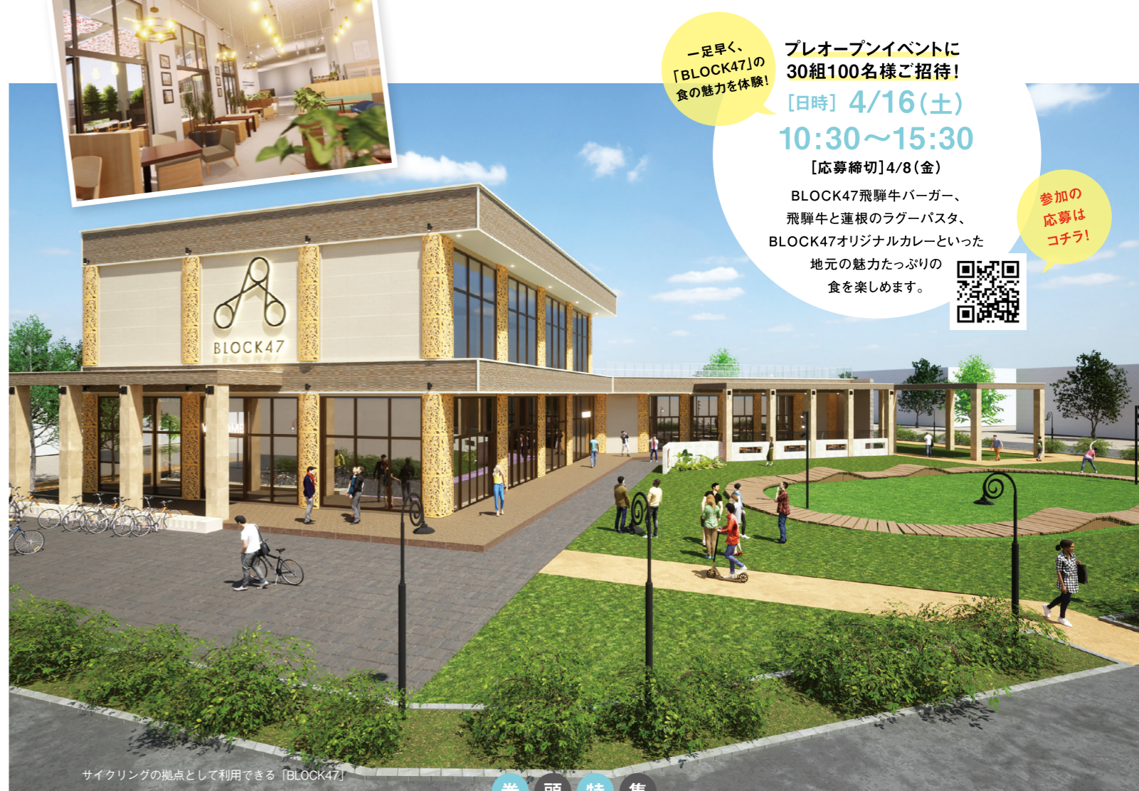
サイクリングの拠点として利用できる「BLOCK47」

「BLOCK47」でのメンテナンスも可能。有料で工具のレンタルもできるので、愛車を自分の手で整備できます