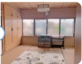
— After —