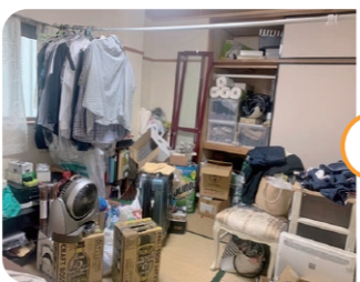
— Before —