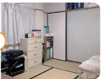
— After —