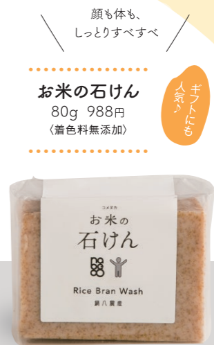
お米の石けん 80g 988円 (着色料無添加)

地元産米の米ぬかを活用したスキンケア製品がある。 お肌に安心・安全な「コメヌカコスメ」。 どこで生まれた、どんなコスメなのか。紹介する。