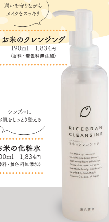
お米のクレンジング 190ml 1,834円 (香料・着色料無添加)