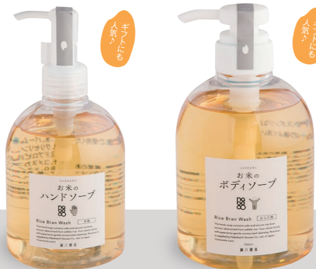
お米のハンドソープ 300ml 1,629円 (カモミールの香り)