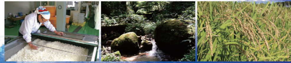
1.平成24年に愛知県で開発された夢吟香。香り豊かで吟醸酒に向けた品種です。2.湯川酒造店がある長野県木祖村は、太平洋に流れ込む木曾川源流の里。3.泉流は創業372年の老舗蔵元である湯川酒造店で丁寧に醸されています

原材料名:米(国産)、米麴(国産) 原料米:愛知県産米 日進市産夢吟香100%使用 精米歩合:60% アルコール度:16度 日本酒度:マイナス2.0(やや甘口) 酸度:1.9 内容量:720ミリリットル 販売:愛知郡小売酒販組合加盟の 酒店または日進市内ファミリーマート各店舗 愛知郡小売酒販組合 電話 0561-73-3122