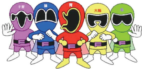
藤枝市オリジナルキャラクター がん撲滅戦隊ウケルンジャー

特定健診やがん検診は不要不急の外出には該当しませんし、完全予約制なので1時間程度で終了します。どうか一人でも多くの市民の皆様にご受診していただき、健やかな生活を送ることができるよう願っております。