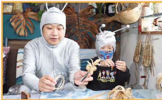
③上手に編めるかな? みんなおしゃべりもせず真剣に作業中!

草を編むのは大変だったけど、ガラガラ星人さんと一緒に作って楽しかった! 今度は太陽染めにも挑戦したいな♪