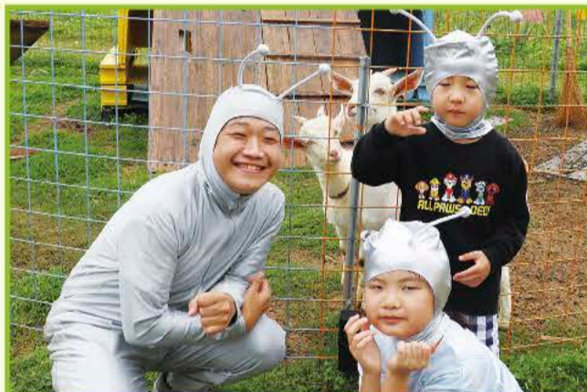
①ヤギさんたちと遊ぶぞー!