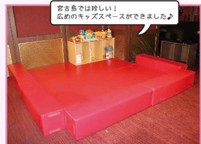
宮古島では珍しい！ 広めのキッズスペースができました♪