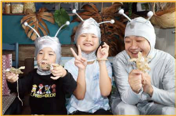
⑥初めてだったけど、楽しく上手にできました!