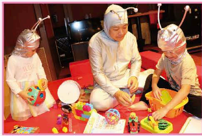
①アブロック、パズル、絵本、つみきなど、 遊べるおもちゃグッズがた〜くさん！