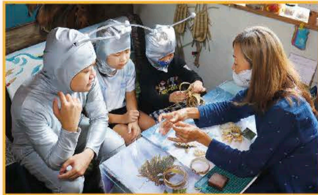
②オーナーに編み方を教えてもらいます。コツをつかめば簡単にできますよ〜♪