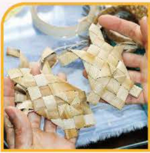
⑤ガラガラ星人 & ぎんじくん作。カメさん