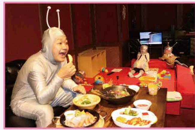
③ちびゲラがDVDに夢中のところ、ゲラゲラ星人はご飯タイム♪ パパもママも、これだったらゆっくりご飯も食べれるわ〜