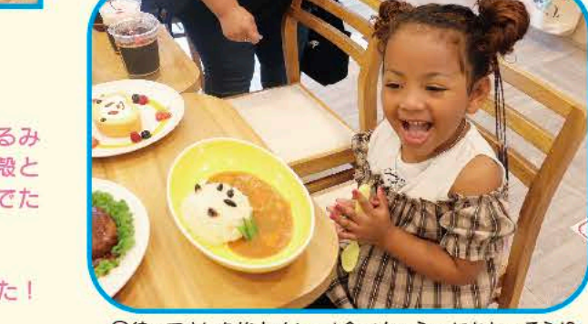
③待ってましたKidsカレー！食べちゃうのがわいそう！ 大人用のカレーもあります。