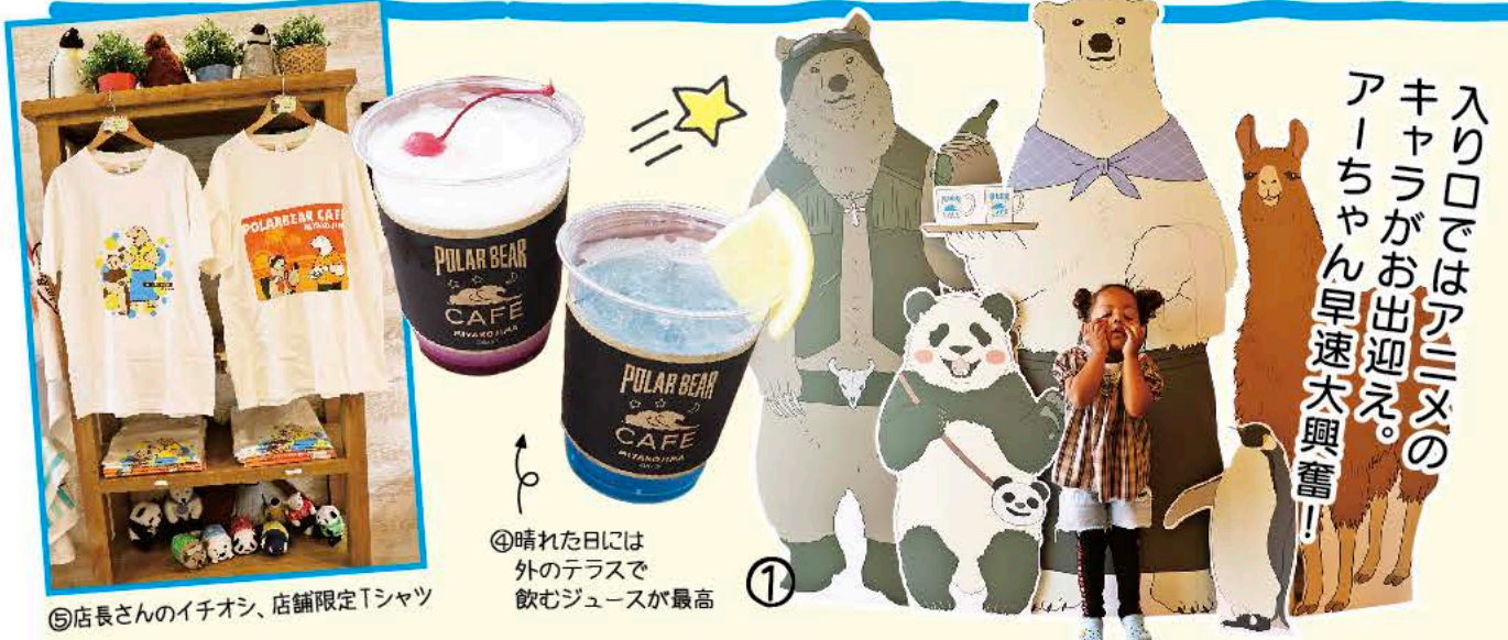
⑤店長さんのイチオシ、店舗限定Tシャツ