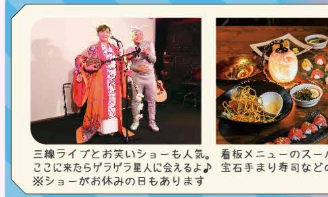
三線ライブとお笑いショーも人気。 ここに来たらゲラゲラ星人に会えるよ♪ ※ショーがお休みの日もあります

お絵描きボードでお母さんとお父さんの 絵を描いたよ！パズルとお絵描きボード がお気に入り！また皆で行こうね！