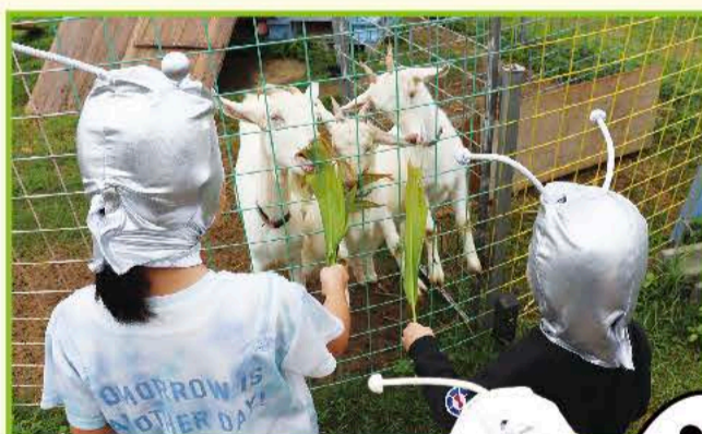
②ヤギさんにエサやり体験。モグモグと葉っぱを美味しそうに食べる音が聞こえたよ