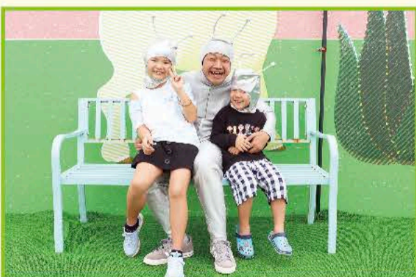
⑤ヤギさんたちとた〜くさん遊べて楽しかった〜お家でもヤギさん飼いたい(笑)