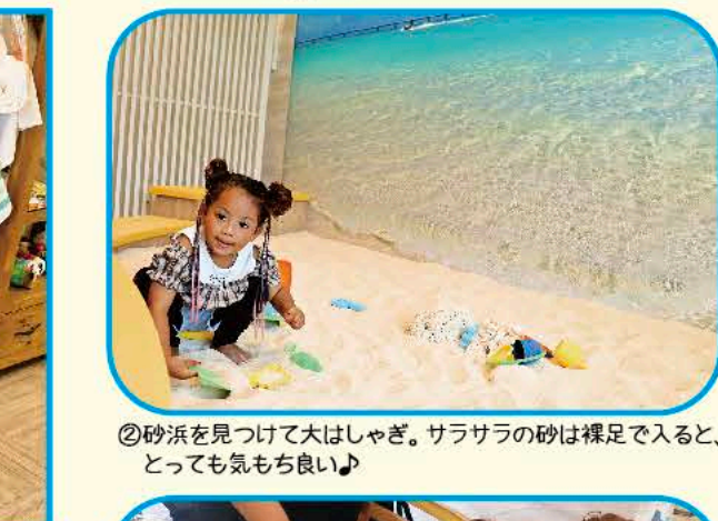
②砂浜を見つけて大はしゃぎ。サラサラの砂は裸足で入ると、 とっても気持ちいい♪