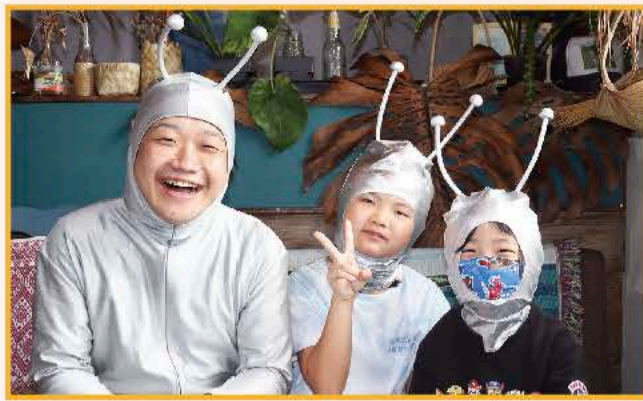
①ガラガラ星人、みのりちゃん、ぎんじくんて草編みに挑戦! 何を作ろうかな〜。