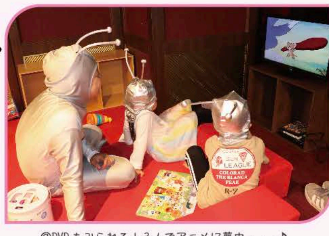
②DVDもみられる！3人でアニメに夢中・・・♪

みんなの大好き！を盛り 込んだ「お子さまプレート」 も登場。サラダ、チ キンライス、ポテトにケ ーキまで♪やったあ