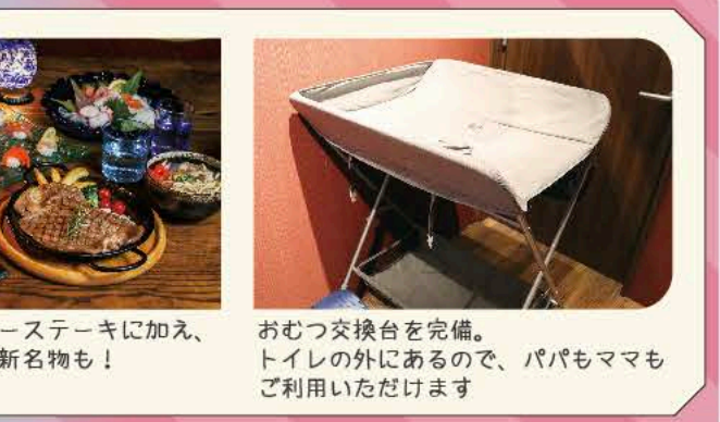
おむつ交換台を完備。 トイレの外にあるので、パパもママも ご利用いただけます