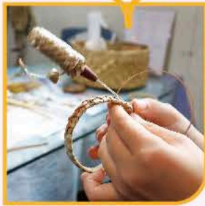
④みのりちゃんの職人技ブレスレット