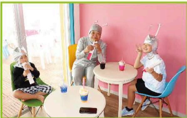
④遊んだ後はカフェで休憩。園で育てたアロエを使ったドリンクや軽食がいただけます。カラフルな内装でぎんじくんのテンションもUP!