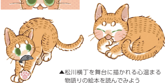
▲松川横丁を舞台に描かれる心温まる物語りの絵本を読んでみよう