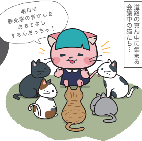
道路の真ん中に集まる 会議中の猫たち...

様子に驚いたそう。もしかすると、猫たちは翌日の観光客をもてなす話し合いをしていたのかもしれない。