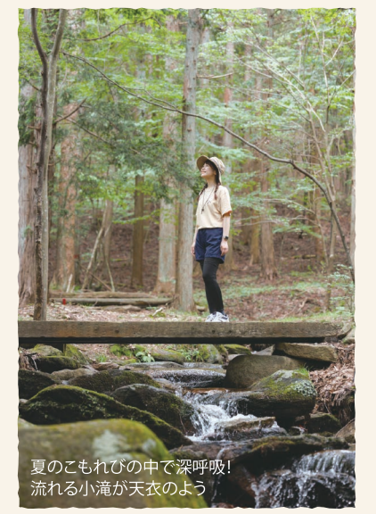
夏のこもれびの中で深呼吸! 流れる小滝が天衣のよう

たまかわ産さるなしを使った さるなしプリン 1ヶ 340円/3ヶ 1,100円 さるなしサブレ 3枚入 390円/8枚入 1,100円