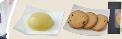
おみやげに オススメ!

たまかわ産さるなしを使った さるなしプリン 1ヶ 340円/3ヶ 1,100円 さるなしサブレ 3枚入 390円/8枚入 1,100円