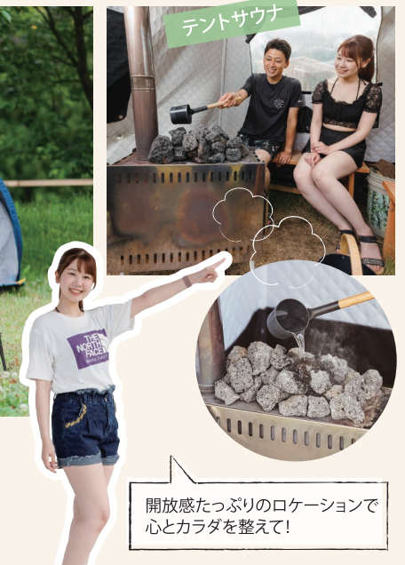
開放感たっぷりのロケーションで心とカラダを整えて!