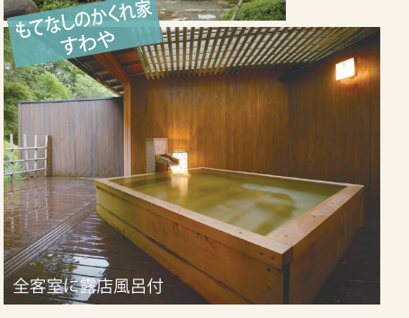
全客室に浴店風呂付