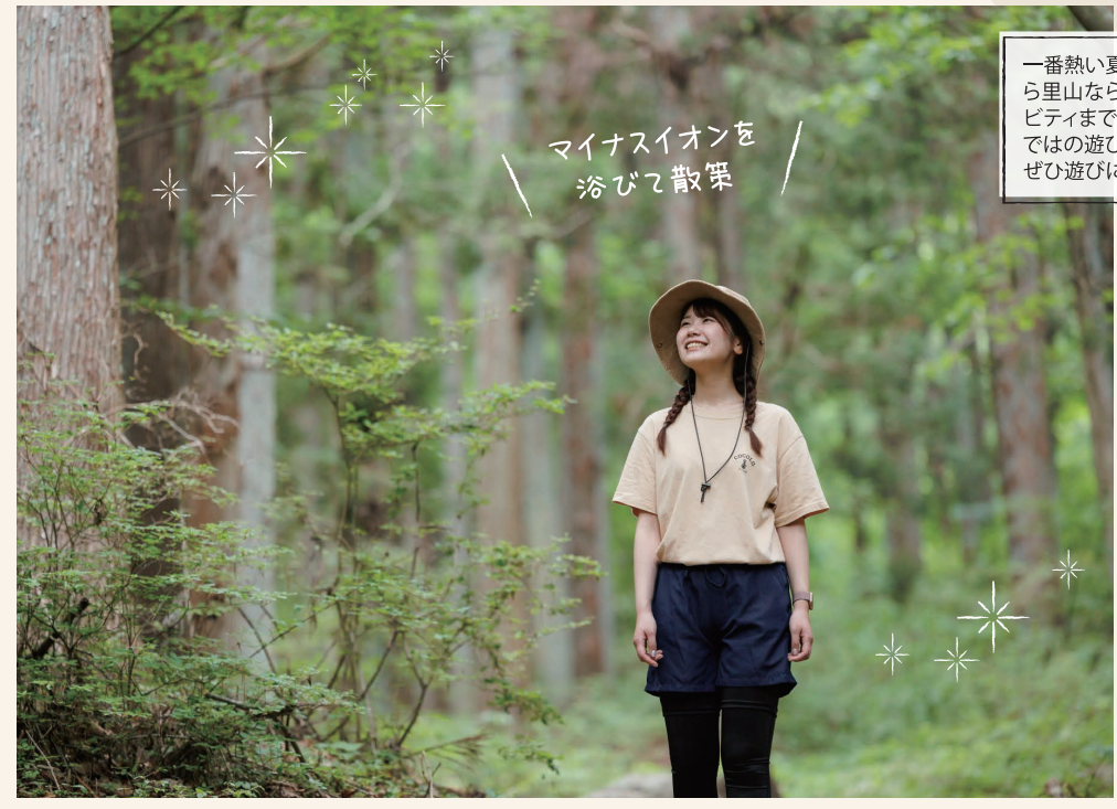
マイナスイオンを 浴びて散策