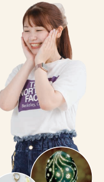
羽ストラップも エミューグッズ

四辻エリアいちばんの魅力は里山の景色。何も無い贅沢。そのものですが、目を凝らせば意外な発見も。ホタルや、絶滅危惧種で日本一小さなハッチョウトンボに出逢えます。里では鮮やかなコオリヨリ、東野の清流近くではミスバシヨウやキスゲを見ることもできます。それから、あまり知られていませんが四辻は標高が高く光源が少ないので、感動的な星空に出逢える場所。時間がある方はぜひ宿泊して欲しいですね。森の駅 Yodge でキャンプや焚き火をしながらの星空観察や、奥たまかわ温泉の隠れ宿「もてなしのかくれ家」もおススメです。独創的な会席料理を味わい、江戸時代からの名湯「万病の湯」でくろろぎ。一日の最後に夜空を見上げてみてください。四辻めぐりの小さな旅が、この夏を忘れられない思い出に変えてくれると思います!!