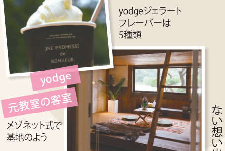
元教室の客室 メソネット式で 基地のよう