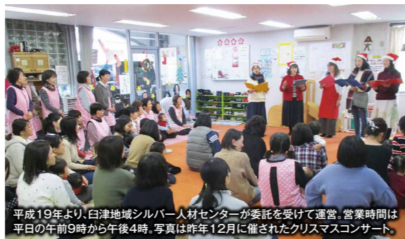
平成19年より、白津地域シルバー人材センターが委託を受けて運営。営業時間は平日の午前9時から午後4時。写真は昨年12月に催されたクリスマスコンサート。

県南地域のシルバーさんには、弊誌「てくてくぶらす」の配布も協力いただいています。感謝の気持ちをこめて、編集部よりスイーツを贈りました。これからも、よろしく願います。