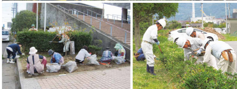
シルバーさんの仕事といえば草刈をはじめ、植木の手入れ・剪定などを思い浮かべるが、他にもさまざまな職種が存在する。