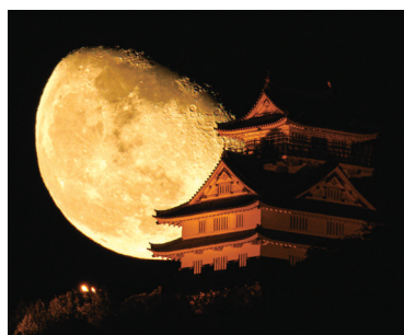
#にっぽん オレンジシンボル運動