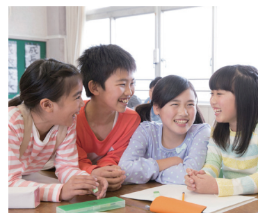
小学生向け 189番周知プロモーション

『地域みっちゃく生活情報誌®』を通じた189番の啓発。全国1300万部を誇る各戸配布型情報誌ブランドを展開する企業としてのネットワークを活用し、毎月啓発活動を行っています。