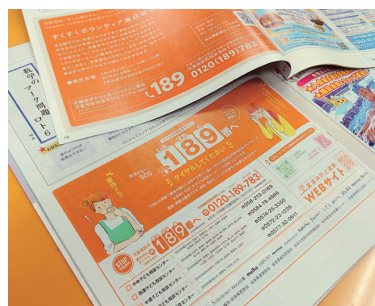
『地域みっちゃく生活情報誌®』 による189番啓発活動