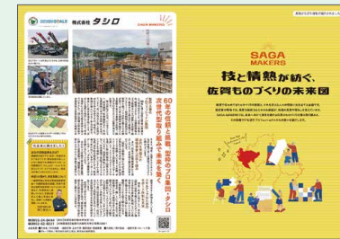
▲「月刊ぶらざ佐賀」9月号企画誌面

第3弾「-SAGAMAKERS- 技と情熱が紡ぐ、佐賀ものづくりの未来図」の狙いは、会社を地域に知ってもらうこと、社員の帰属意識向上、そして求人への活用です。掲載された5社すべてが初掲載でしたが、読者から好意的な反響が寄せられ、地域貢献の一助となっています。今後も継続的に展開し、佐賀をもっと元気にしていきます！