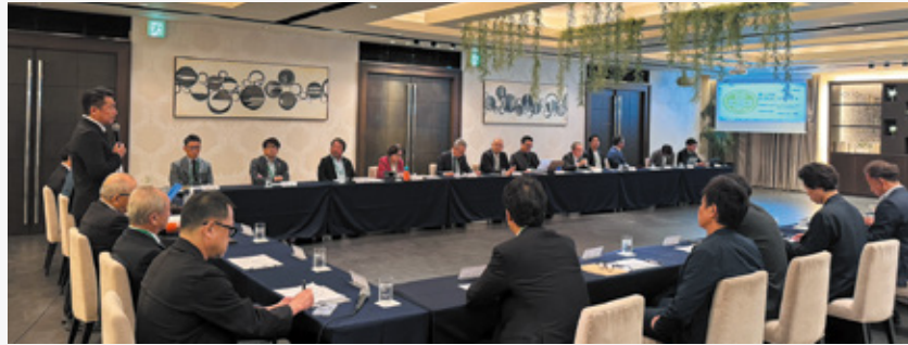
経営者会議ではVC加盟社の代表が集まり、喫緊の地域課題である求人について議論が交わされました

じたワードトップ10」など、地域の人材難解決の手助けになる、具体的かつ深度あるデータまで共有されました。