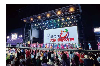
▲「どまつり in 大阪・関西万博」の総踊りでも披露

CHUCO GROUP CSR 当社では、地域社会への貢献に積極的に取り組んでいます