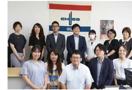
▲「SARUBOBO」編集室のスタッフ

岐阜県高山市・飛騨市・下呂市・白川村で54,500部を発行する『SARUBOBO』は、来年4月に創刊30年を迎えます。