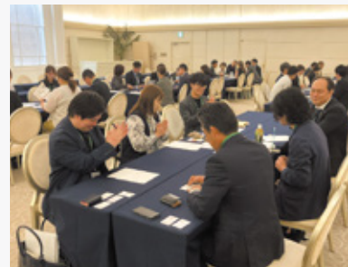
情報誌を磨き上げるためにさまざまな議題を議論した現場メンバー会議

次は初の中四国九州、関東、そして第二回を迎える東北と、今期は各地のブロック単位のVCサミットが控えています。全国で『地域みっちゃく生活情報誌®』を発行するVC加盟社に役立つ情報を提供することは、情報誌の質向上と、地域課題の解決につながります。結束を高め、地域を元気にする情報誌の輪を上げてまいります。