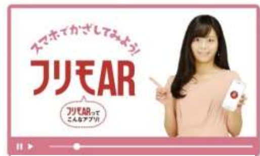
アプリで上記画像を読み込むとARを体感頂けます

※AppleおよびAppleロゴは米国その他で登録されたApple Inc.の商標です。App StoreはApple Inc.のサービスマークです。 ※Google PlayおよびGoogle PlayロゴはGoogle Inc.の商標です。