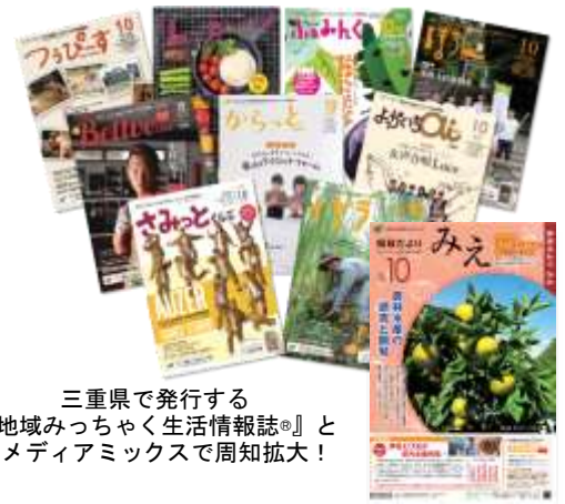
三重県で発行する『地域みっちゃく生活情報誌®』とのメディアミックスで周知拡大！

http://www.pref.mie.lg.jp/DAYORI/index.htm