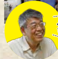
ようこそきーずハウスへ

は、地域の人々が気軽に立ち寄れるコミュニティースペース。ってくる人たちにお話しを聞きました。