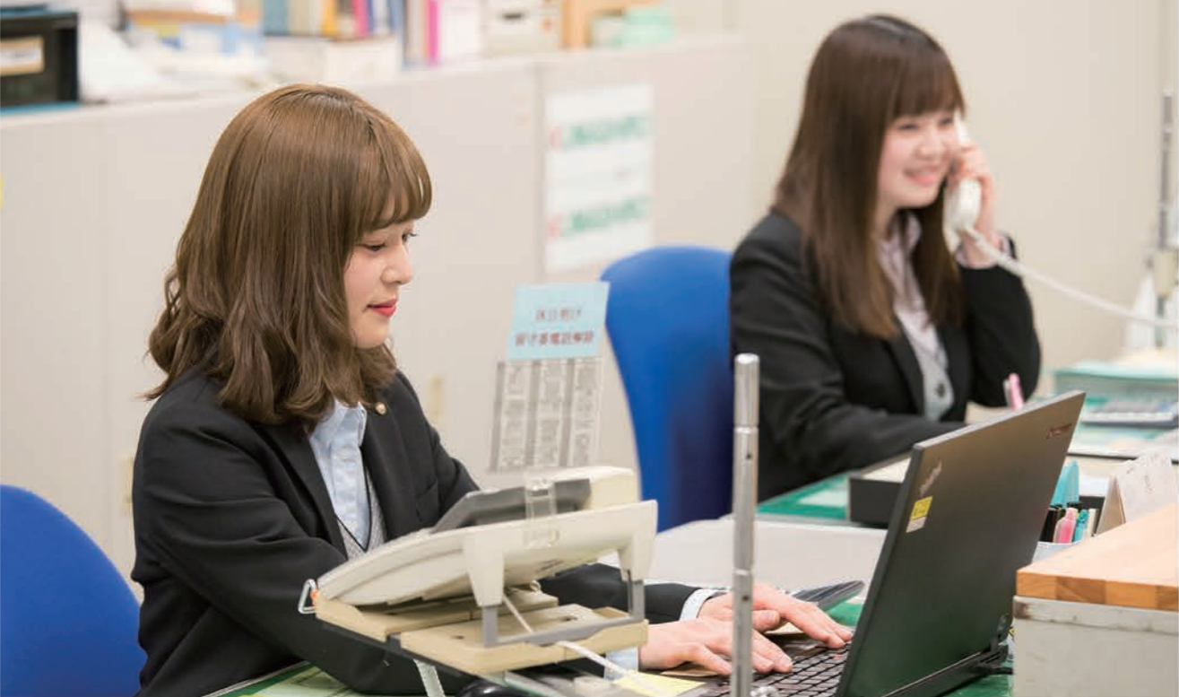
小さなことでも「ありがとう」とい合う社風が、居心地の良い職場づくりにつながっています