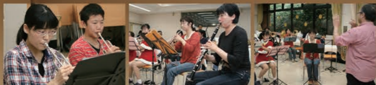
東海吹奏楽団では、日頃の練習に加え、1泊2日でアンサンブル合宿も実施。1日目に練習を行い、2日目の午後に仲間内で発表会を開いています