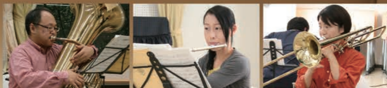
名古屋市内だけでなく、岡崎やあま市などから練習に通う団員も。年齢性別を問わず、幅広い層の音楽好きが所属しています