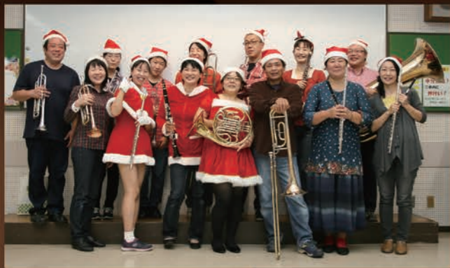
「会場を楽しく盛り上げたい」と、団員それぞれが自前で衣装を用意して、クリスマスコンサートに臨みます

また、子どもたちを中心に、来場者にはお菓子のプレゼントも。地域の人々が楽しめる内容を企画中です。足を運んでみてはいかがでしょうか。