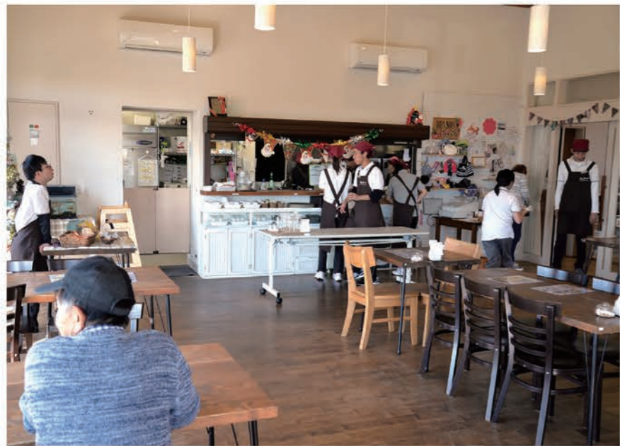
明るく、開放感のある店内。周りは水田になっているため、見晴らしは抜群です。線路を走る電車や貨物列車も眺められます

イベント情報 詳しくはイベントニュースをチェック クリスマス会 12/23(土)祝 11:00~14:30