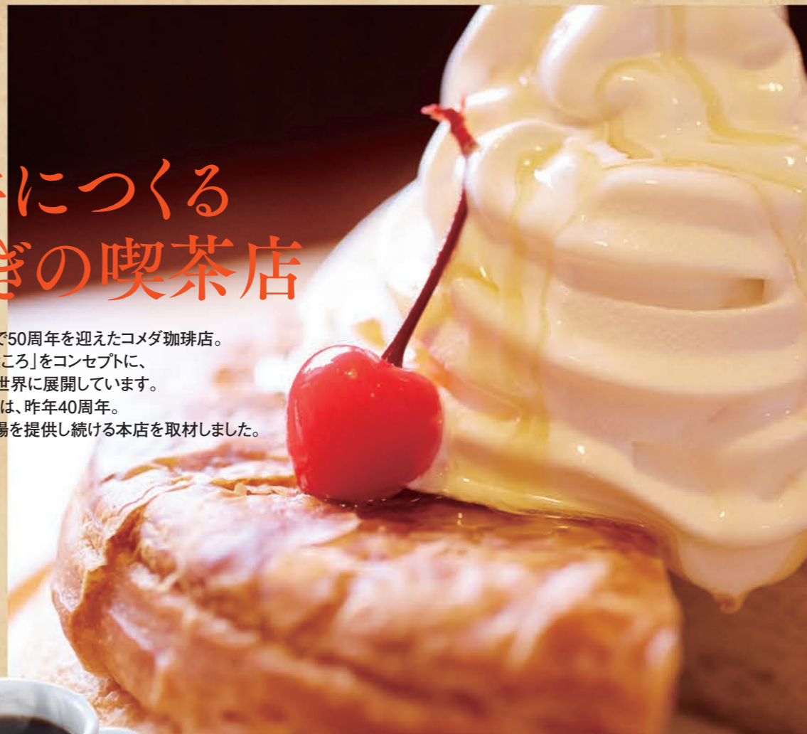
看板メニューのシロノワール。64層のさくさくしたデニッシュと冷たいソフトクリームが大人気です

1968年に創業し、今年で50周年を迎えたコマダ珈琲店。「くつろぐ、いちばんいいところ」をコンセプトに、名古屋から全国、そして、世界に展開しています。瑞穂区上山町にある本店は、昨年40周年。地域の人々にくつろぎの場を提供し続ける本店を取材しました。