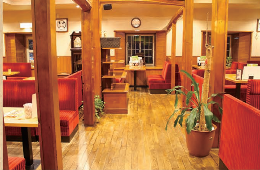
(左)広々とした店内を大きな柱でさりげなく仕切り、プライベートな空間を演出しています(下)本店の壁には1968年のコマダ珈琲店創業記念プレートが飾られています