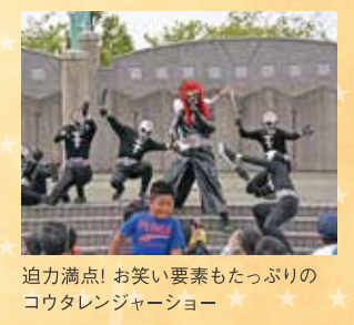
迫力満点! お笑い要素もたっぷりのコウタレンジャーショー

ぞれシナリオが違うんですよ。バク転やバク宙、アクションシーン満載で、見ごたえ抜群」と太鼓判を押しています。