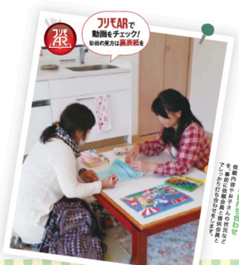
「FIREAR」で動画をチェック！動画の見方は裏表紙を

近年、特に子育て支援に力を入れている古賀市と新宮町。では実際に、どんな子育て支援活動が行われているのでしょうか。今回はそれぞれのエリアで新たに活動を始めた2団体取材してきました。