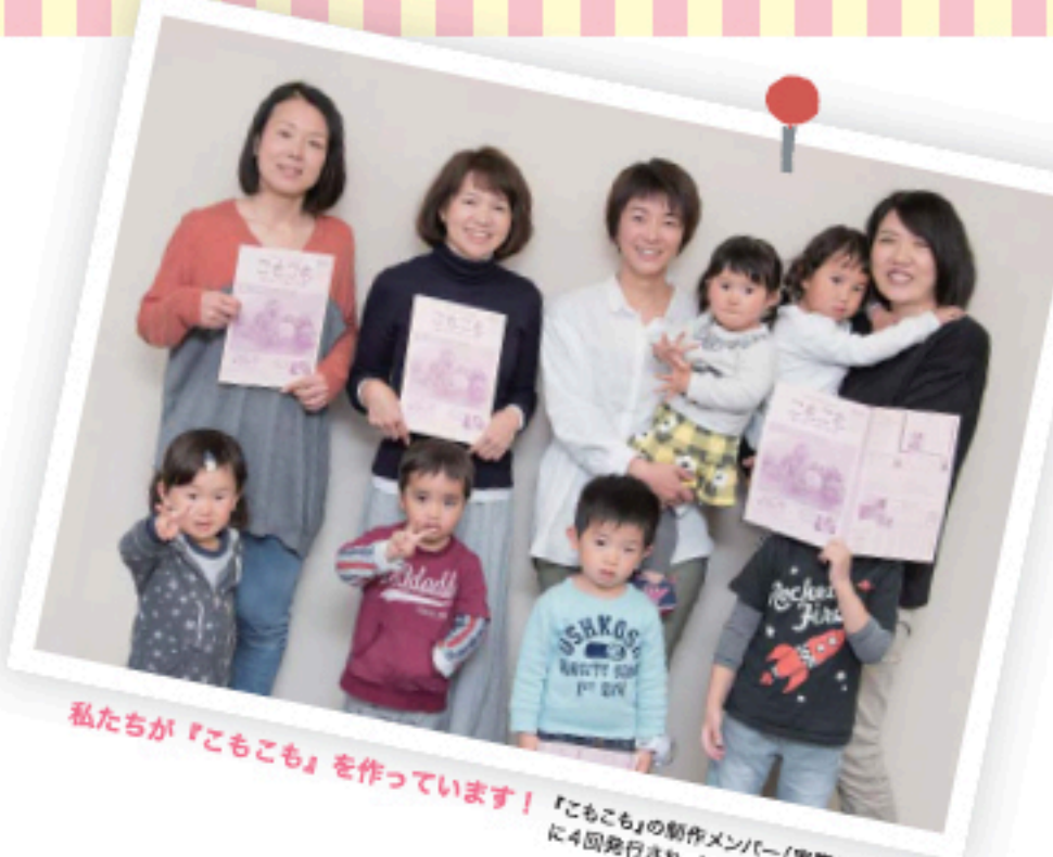
私たちが「こもこも」を作っています！「こもこも」の制作メンバー（実際は5名）が4回発行され、A4版の8ページ仕立て。