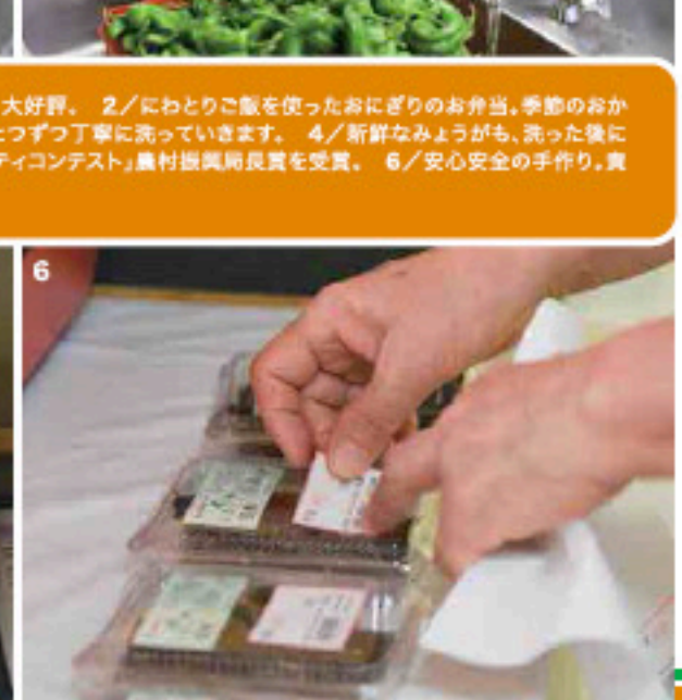
1/味のアンケートをもとにつくられた甘めの卵焼きは男性にも大好評。 2/にわとりご飯を使ったおにぎりのお弁当、季節のおかずと一緒に。 3/加工品でもよく登場する甘長とうがらし、ひとつずつ丁寧に洗っていきます。 4/新鮮なみょうがも、洗った後に状態をしっかりチェック。 5/平成27年に「第24回食アミニティコンテスト」農林振興局長賞を受賞。 6/安心安全の手作り、責任を持って品質管理もしっかりされています。