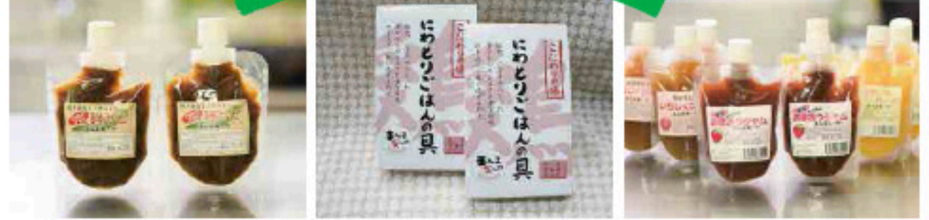
甘長とうがらしを使ったちょっぴり辛い風味。ごはんに合います！(440円) ご飯と混ぜるだけで手軽に美味しく！郷土料理の具「にわとりごはん」(550円) 地元古賀の果物を100%使用、使いやすいパウチで大人気のジャム(350円)