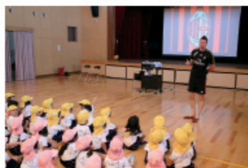
地域貢献として小牧市内の幼稚園や保育園を訪れて交流を深めています

また障がい者の就労支援「心のバリアフリー」を推進。地球子ども村では障がいがある人が職員として23人勤務しており、パソコン入力や軽作業など一般就労へとつなげるサポートをしています。