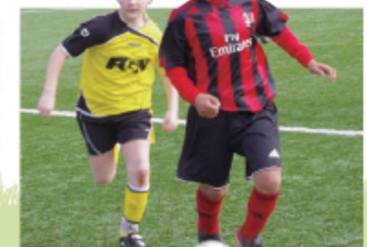
ヨーロッパの国際大会ではACミラン愛知としてチームを編成

日本初のACミランのスクール。開校から数年が経過し、より日本人に達したトレーニングを実践できているとスタップは胸を張ります。練習拠点のパークアリーナ小牧では、練習見学や体験も可能です。